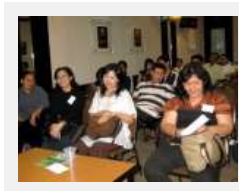
Peserta pelatihan pembangkitan Kundalini